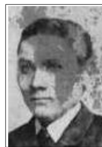
Christen Møller Larsen - ca. 1890